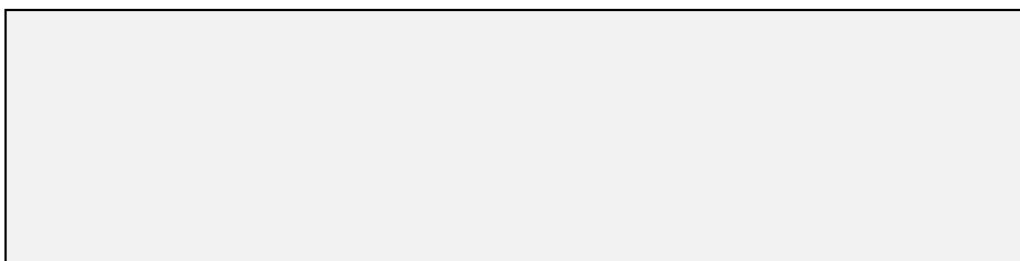
Слика 6. Наслов слике [1]